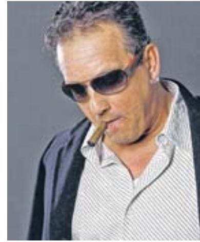
Der Schauspieler – hier einmal betont leger und cool.

Dennoch freut er sich über jede neue Erfahrung, an der er wächst. „Ich habe keine klassische Schauspielerausbildung, sondern konnte einfach über mein Talent, privaten Schauspielunterricht und Durchhaltevermögen in die Branche ein-