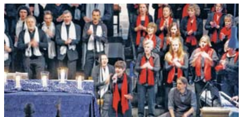
Der Chor Family of Peace beim Auftritt im vollbesetzten Münster